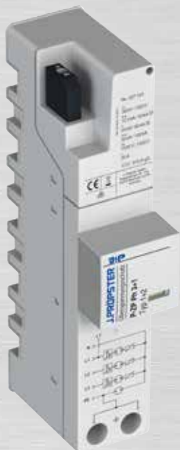
Best.Nr. 337 143