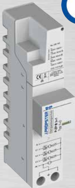
Best.-Nr. 336 140